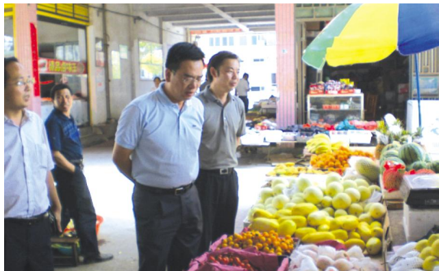
区委书记杨昆调研市场

报告”等各项目标任务,突出实施“粮安工程”和助推开放型经济发展两项重点工作,落实责任、强化措施,全面完成了区委、区政府和市商务、粮食局下达的年度目标和任务指标,全局创先争优取得显著成绩。党风廉政建设、综治民调、实事办理3项工作被评为君山区先进单位,“文明创建”工作获得突出贡献奖。