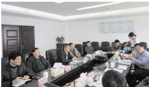
向省市移民局领导汇报工作

规范运作,确保移民后扶资金安全运行。在移民后扶资金的使用上实现转变。去年以来,该局全面核