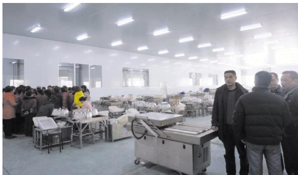
在洞庭水湘食品有限公司检查工作

在能力建设上实现新常态。该局不仅从干部内部加强政治、思想、业务能力建设,认真开展“三严三实”教育活动,同时举办业务培训班增强干部业务素质,提升服务移民能力。争取县委、县政府的重视,去年该局从乡镇调入 3 名同志到该局工作,充实办公室、规划计划和财务岗位。同时,大力推荐优秀的中层骨干到其他地方担任领导职务,该局干部机构更趋合理,年轻化,专业化。在作风建设上实现新常态。该局进一步加大作风建设的力度,在制度上更严。机关干部上班实行上、下午签到制,严格执行机关公务接待管理办法,实行来函接待制度。在监督上更严。每逢节假日,对违反“四风”问题专门督查,发现问题及时整改。在廉政建设上实现新常态。认真落实“两个责任”,制订“三重一大”、“末位表态”、“个人重大事项报告”、“四个不直管”以及党务、政务公开制度。健全各项廉政建设制度,完善约束监督机制,为移民当好家、理好财、办好。该局在 2014 年省审计的审计工作中,经受住了审计的考验,没有干部在金钱、权力面前褪色。