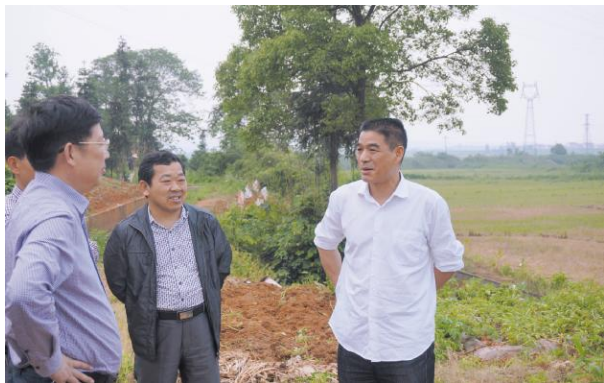
深入乡镇检查指导工作

实了移民重点乡镇和移民重点村,项目资金 100% 安排在重点乡镇,84% 的资金安排在库区和移民安置区。52% 的资金安排在重点村。在移民资金的管理上实现转变。该局移民后扶资金严格遵循“三个跟着走”的原则,用好管好移民资金。严格实行县级报帐制,将项目资金打入业主帐户。申报程序规范并公示。所有项目严格申报程序,以村为单位,乡镇统一上报,所有工程项目在实施前要有相关的设计,论证报告,有前期相关资料。要求 5 万元以上的项目,局工程管理股到现场察看,50 万元的报市局审定,100 万元以上的报省局备案审批。工程验收规范,每一个项目都必须到现场验收。资金拨付限时办结,确保资金及时下拨。