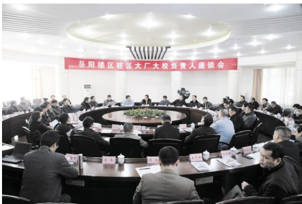
岳阳楼区驻区大厂家校负责人座谈会

岳阳楼区厂地协作局和工业园在区委、区政府的正确领导下,以“转作风、强能力、重实干、创新高”为要求,认真履职,奋力拼搏,开拓创新,各项工作全面推进,取得了一定成绩。