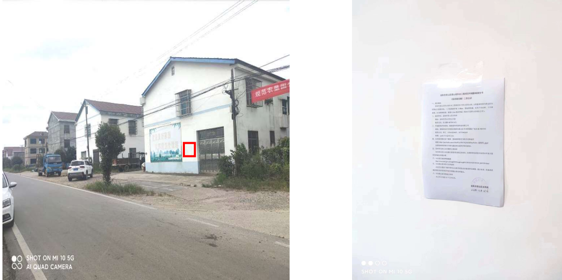
图 4 项目现场公示照片

张贴区域选择在君山区芦花洲村，张贴的时间为 2021 年 12 月 23 日~2022 年 1 月 6 日，共计 10 个工作日。公示内容明确了需查阅纸质报告书的联系方式及地点（即环评联系人及公司地址）。