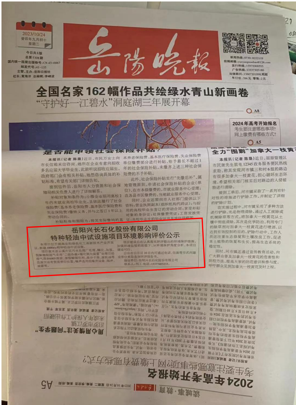
图 3-1 项目报纸上公示图片（第一次）