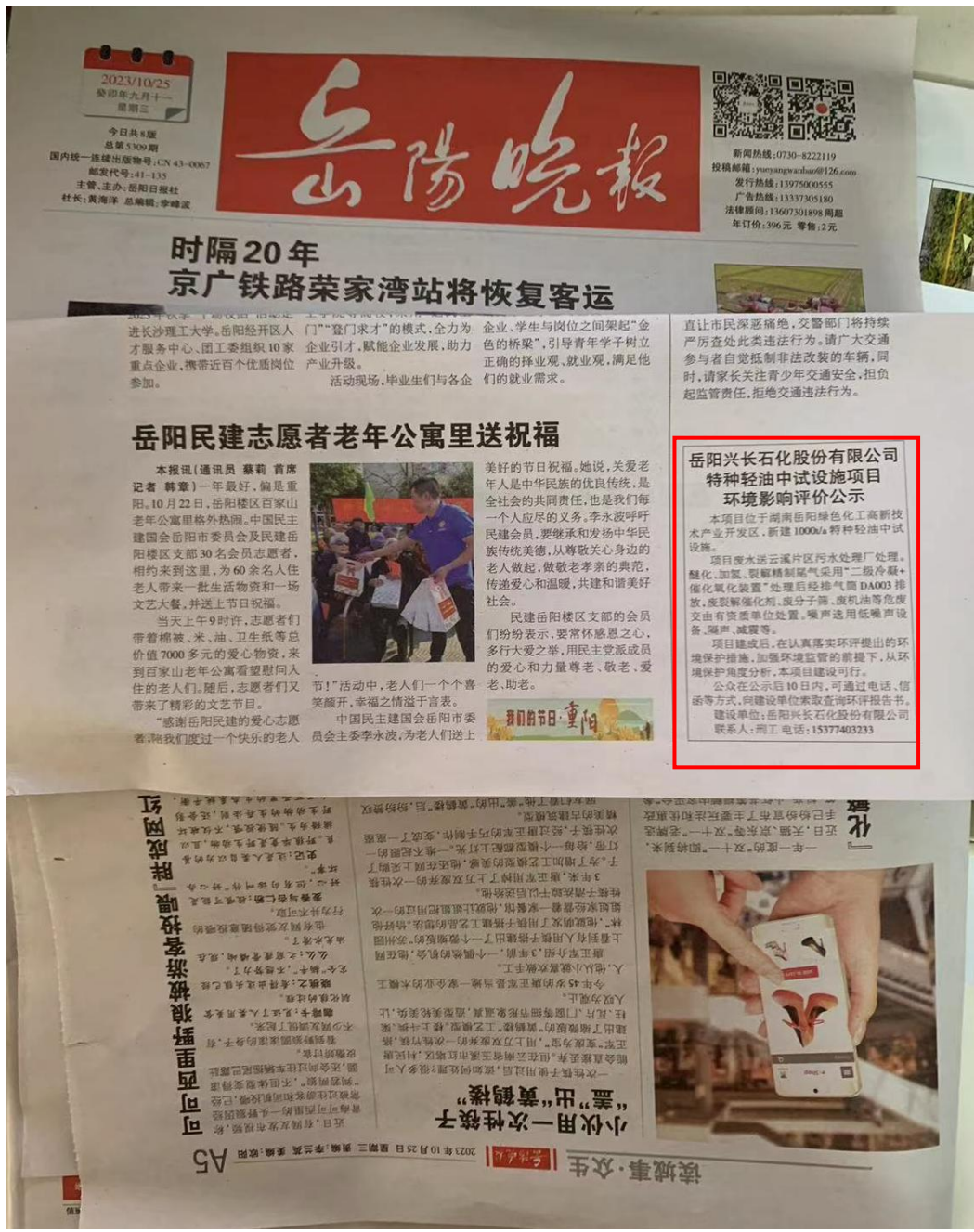
图 3-2 项目报纸上公示图片（第二次）