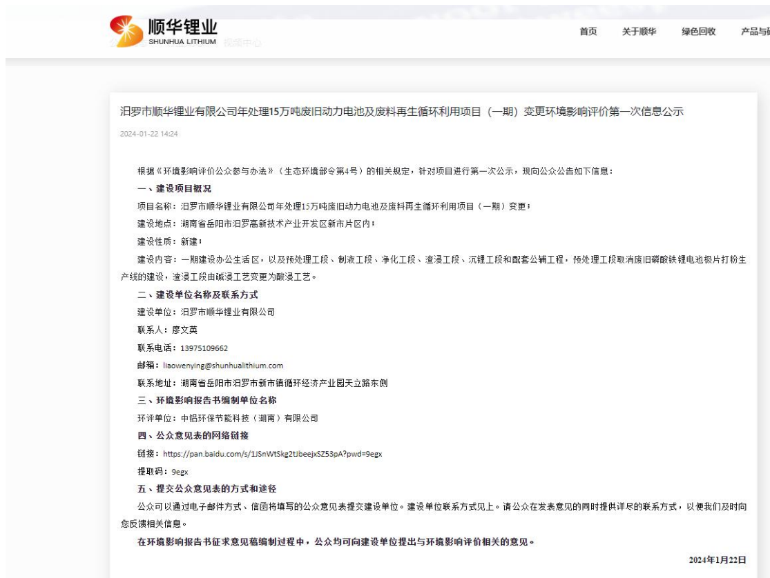
图 2-1 首次环境影响评价信息公示

首次公示选择的网站为环境影响评价信息公示平台，符合《环境影响评价公众参与办法》通过其网站、建设项目所在地公共媒体网站或者建设项目所在地相关政府网站”公示的要求。