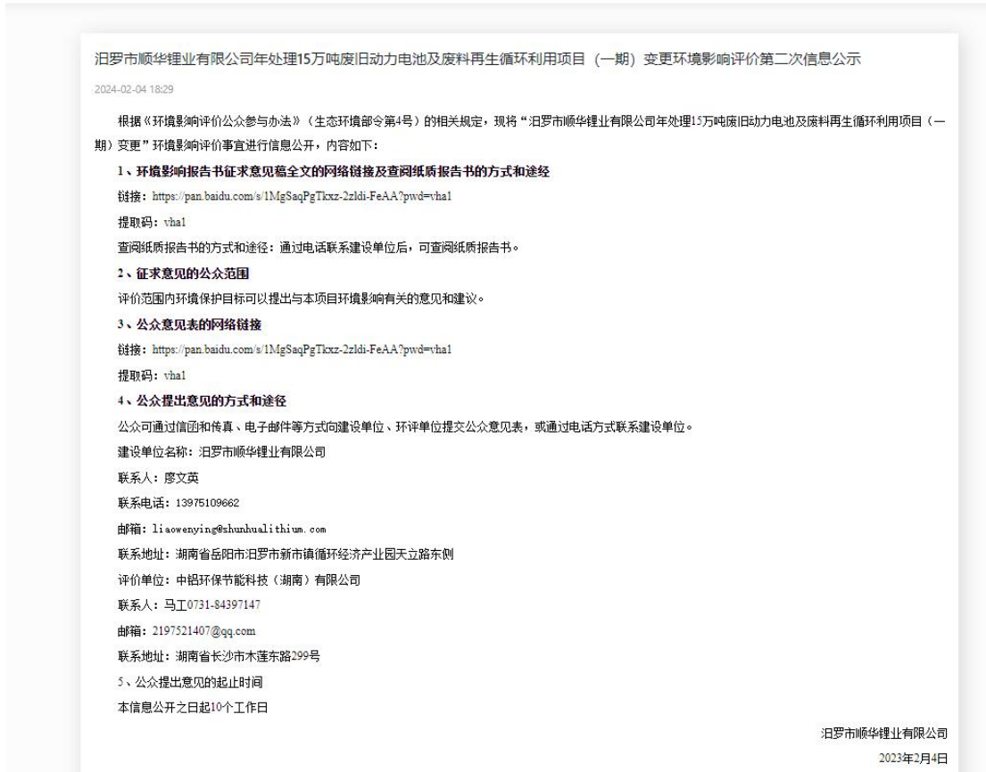
图 3-1 征求意见稿环境影响评价信息公示