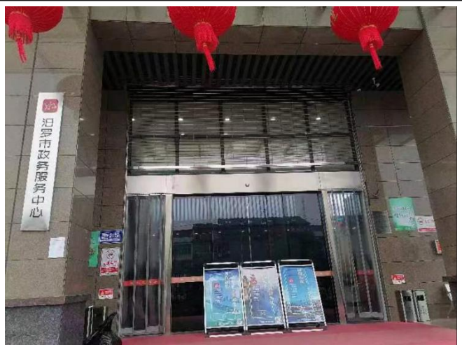
汨罗市政务服务中心公示