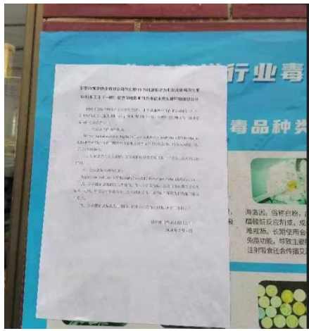
园区生活区公示近照