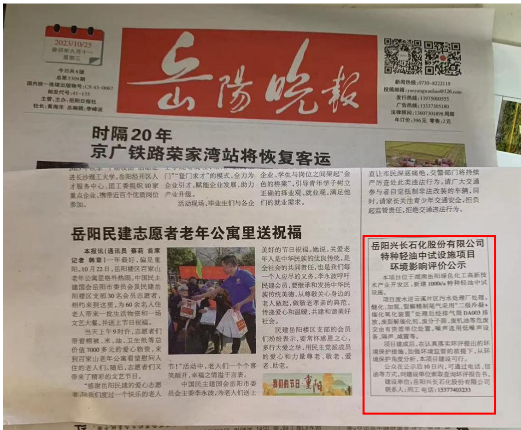
图 3-2 项目报纸上公示图片（第二次）