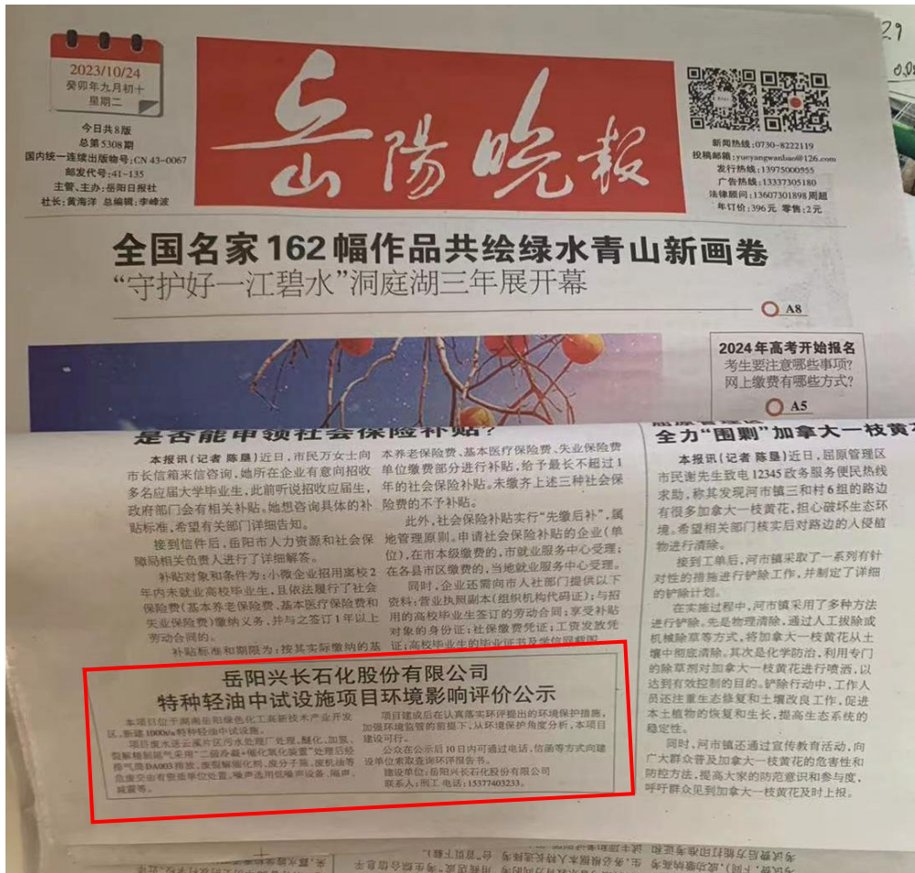
图 3-1 项目报纸上公示图片（第一次）