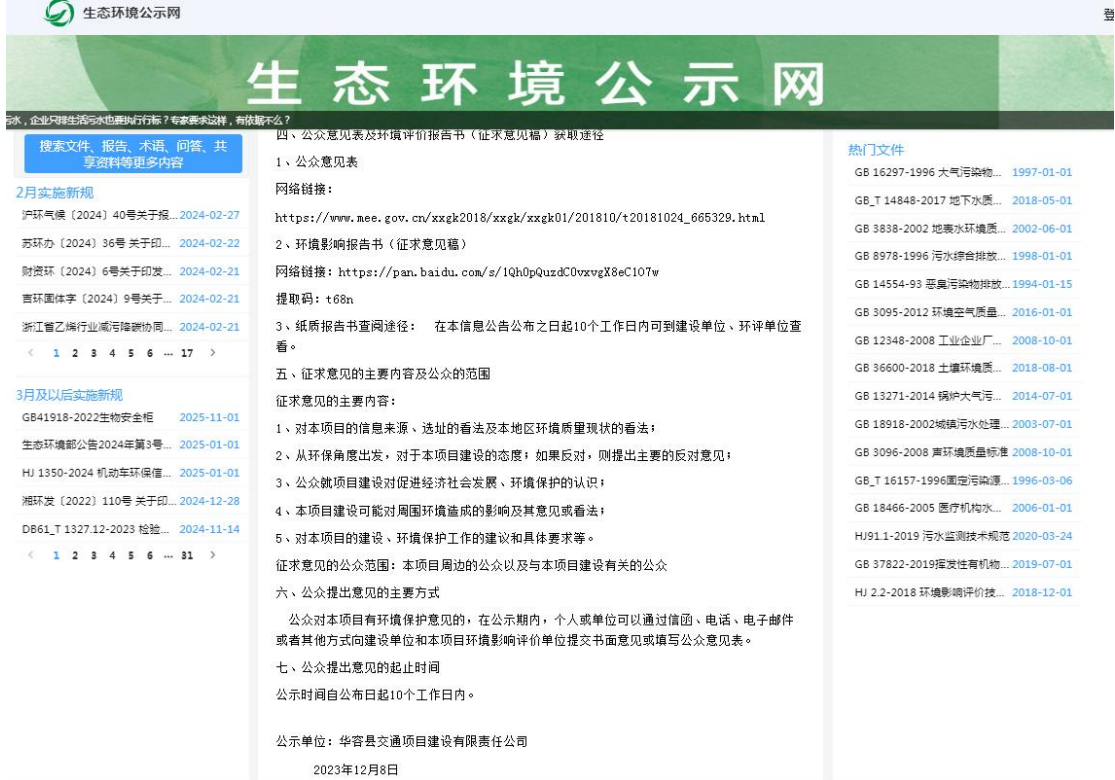
图 2 第二次网络公示截图